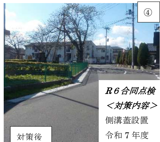
④ 対策後 R6 合同点検 ＜対策内容＞ 側溝蓋設置 令和7年度