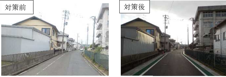
③ 対策前 対策後 R6 合同点検＜対策内容＞ 側溝蓋設置 歩行帯のカラー化 令和7年度 学校前線