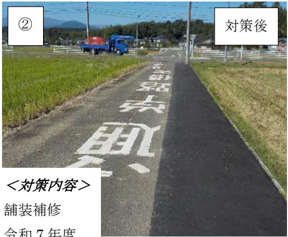
② 対策後 ＜対策内容＞ 舗装補修 令和7年度