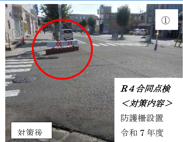
① 対策後 R4 合同点検 ＜対策内容＞ 防護柵設置 令和7年度